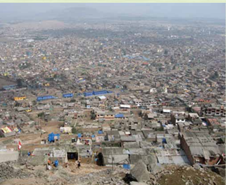
Pueblo joven de Huallaringa