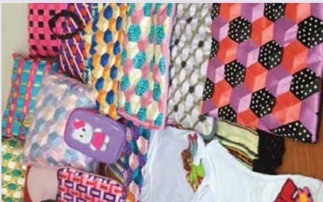
Especialidad de Tecnología Textil