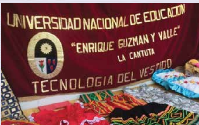
Especialidad de Tecnología del Vestido