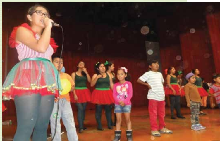
Auditorio principal de la Universidad