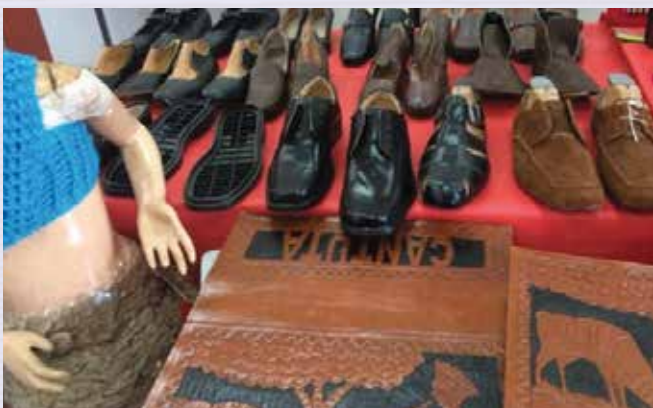
Especialidad de Artes Industriales