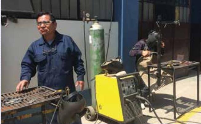
Especialidad de Construcciones Metálicas