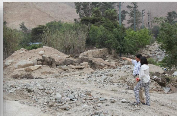
GESTION DE RIESGO DE DESASTRE